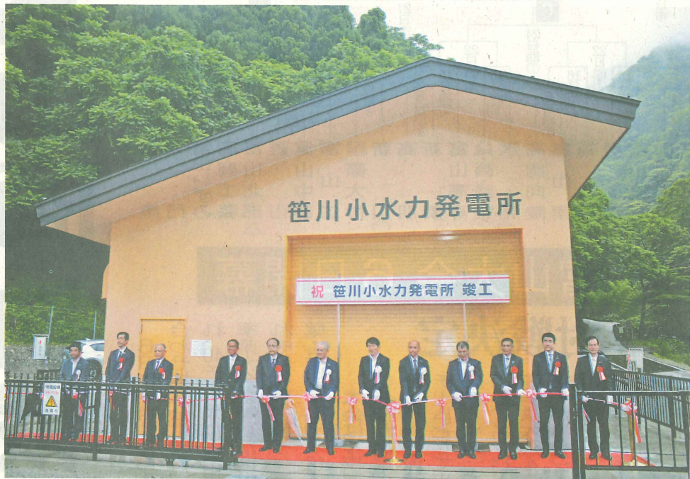
テープカットで小水力発電所の完成を祝う関係者。売電収入で地区の簡易水道設備を更新する