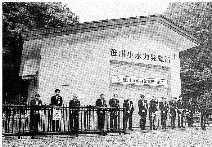
テープカットで竣工を祝う関係者

事業推進にあたって町が水道設備新設費用を補助金で3割を負担。住民も建設用地をほぼ無償で提供し、北陸銀行が優遇